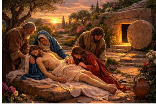
Immagine realizzata con IA

Cristo Amore, rimane saldo quando tutto crolla (Cresime II)